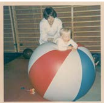
Der Autor mit Frau H. im Balgrist in Zürich, 1968.

Neurorehabilitation ist ein Zusammenspiel verschiedenster Disziplinen: Von der Neurologie über die Physio- und Ergotherapie bis zu Logopädie oder Hippotherapie. Der Autor kennt von klein auf insbesondere die Physiotherapie – und hält sie für weithin unterschätzt. Ein Plädoyer.