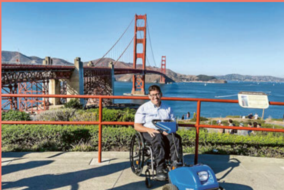
L'autore davanti da uno scenario di fama mondiale.