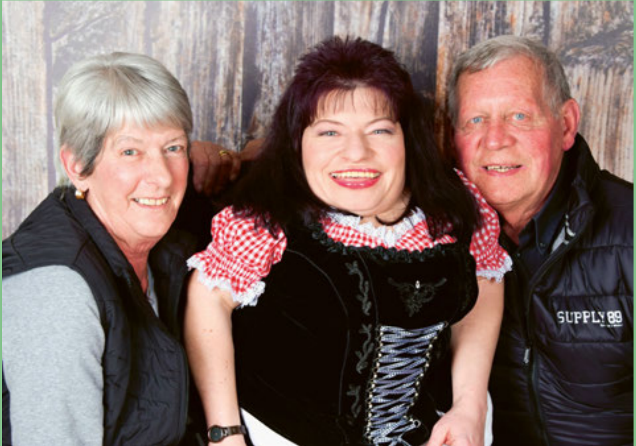
Mit ihren Eltern.

Argument, im Ausland keine Kosten zu übernehmen. Somit schloss ich mein Studium in Fribourg ab.