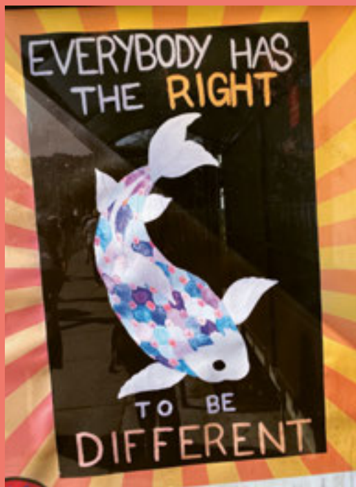
Berkeley e il luogo di nascita del movimento della vita autodeterminata.