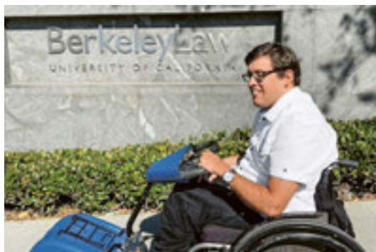
Der Autor an der Universität Berkeley. S. 5: Das Hauptgebäude der Universität Zürich

Im Jahr 2008 absolvierte ich ein Austauschjahr an der University of Georgia (nahe Atlanta) im Südosten der USA. Von einer früheren Reise war mir die weit ausgebaute hindernisfreie Architektur sowohl im öffentlichen als auch im privaten Sektor bekannt. Die ersten Kontakte mit der Universität waren vielversprechend und ich fühlte mich willkommen. Nach einer langen administrativen Vorbereitung war es soweit. Die Aufregung über die einmalige Chance liess die Sorgen, dass etwas schiefgehen könnte, in den Hintergrund treten. Das war auch gut so, denn eine gewisse Portion Abenteuerlust und Flexibilität gehört bei so einem Unterfangen dazu. Rückblickend kann ich sagen, es war richtig und wichtig. Das Leben auf dem weiten Campus zusammen mit rund 40 000 Studentinnen und Studenten war eine prägende Zeit, die tiefe Freundschaften formte. War immer alles problemlos? Nein. Meine Gegenfrage: Läuft hier alles immer problemlos und einfach? Die ehrliche Antwort ist auch hier nein. Aber ich habe gelernt, mit ungeplanten Vorkommnissen, mit einer anderen Kultur, einer anderen Sprache und nicht zuletzt mit einem anderen Bildungssystem umzugehen. Dies gab und gibt mir heute noch eine innere Stärke. Grossartige Erlebnisse, wie z. B. ein von der Univer-