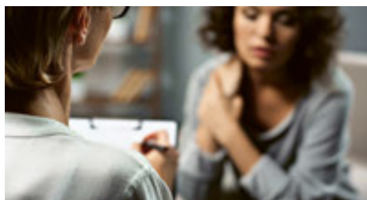
Le principe aléatoire doit être introduit pour toutes les expertises.

L'analyse de l'OFAS mentionne l'existence, parmi les experts, de quelques «brebis galeuses» qui exploiteraient le système. Or, de l'avis d'Inclusion Handicap, cela revient à sous-estimer l'ampleur du problème – notamment si l'on songe à l'énorme chiffre d'affaires que génèrent les experts grâce aux mandats des offices AI. S'ajoute à cela le caractère douteux du choix des expertes et experts. On ne tient de toute évidence pas suffisamment compte des voix des assurés, qui sont les personnes concernées.