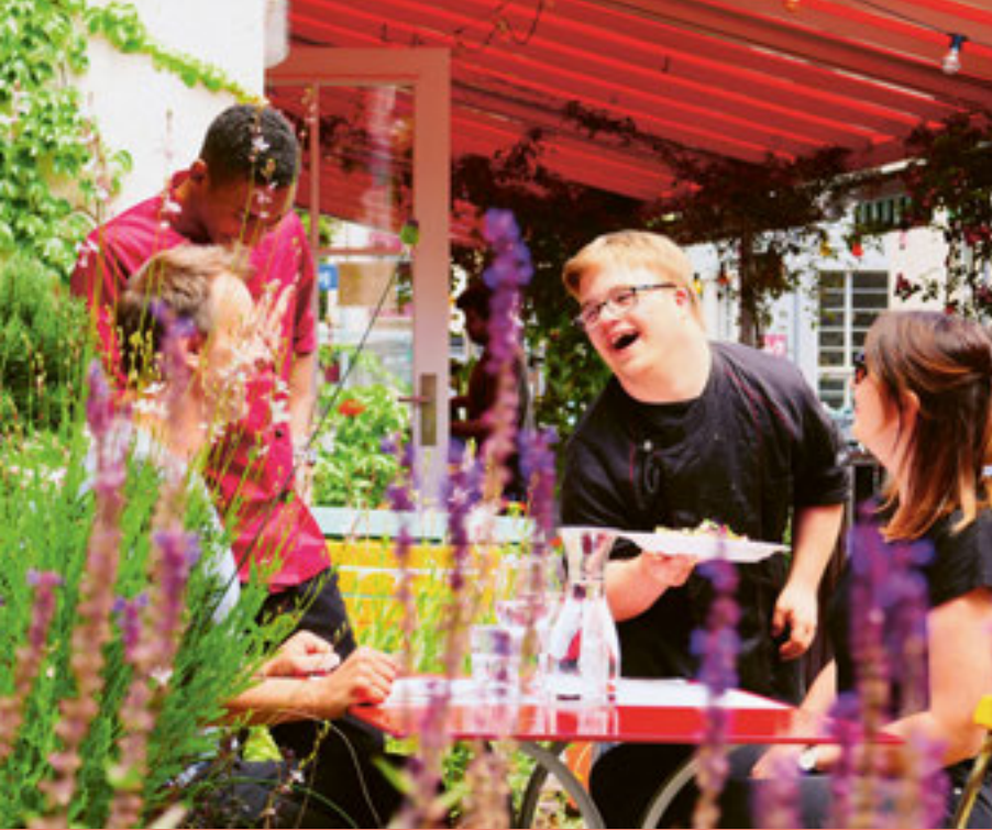
La preparazione all'inserimento professionale è importante