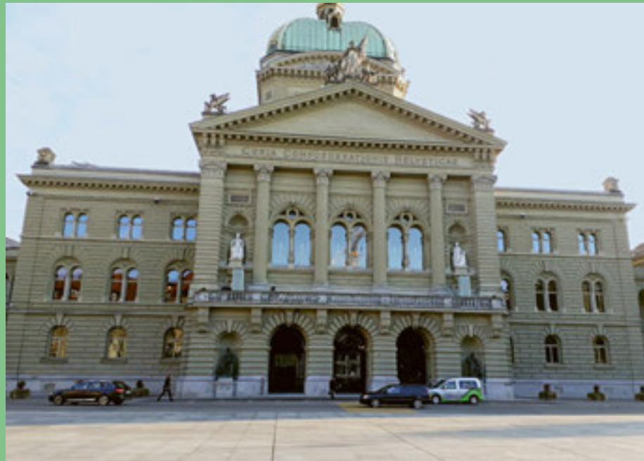
Die berufliche Eingliederung wird durch die Weiterentwicklung der IV gestärkt.